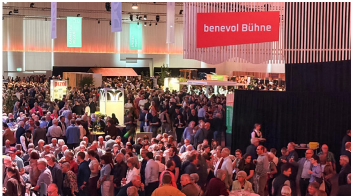
Mitten im Geschehen: Über 4'000 SGKB-Aktionärinnen und -Aktionäre erlebten die benevol-Bühne als Herzstück des Unterhaltungsteils der diesjährigen GV.

benevol St.Gallen konnte sich Ende April an der Generalversammlung der St.Galler Kantonalbank einem grossen Publikum präsentieren. In der Kantonalbank-Halle der Olma Messen erreichte die Fachstelle rund 4'000 Aktionärinnen und Aktionäre – gemeinsam mit neun Partnerinstitutionen, die durch die SGKB im Rahmen ihrer Freiwilligentage unterstützt werden.