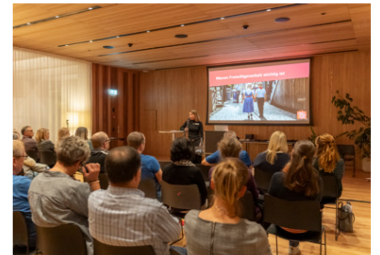
Das Gros der Ostschweizer Gemeinden ist sich sehr bewusst, wie wichtig freiwillig Engagierte für eine lebendige, attraktive Kommune sind.

Handlungsbedarf zeigt sich bei der Anerkennung. Nur etwas mehr als die Hälfte organisiert regelmässig Dankesveranstaltungen. Auch bei der Ansprache von Pensionierten liegt Potenzial. Sie bringen Erfahrung und Zeit mit.